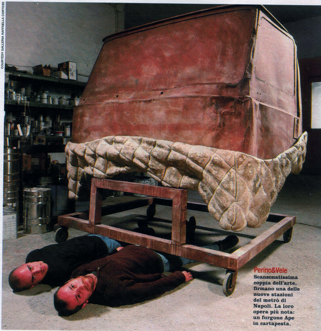
Perino&Vele Scanzonatissima coppia dell'arte, firmano una delle nuove stazioni del metrò di Napoli. La loro opera più nota: un furgone Ape in cartapesta.

PROTAGONISTI Lavorano e (talvolta) vivono in coppia, se non in gruppo. Condividono spazi, diverbi e successi. Le nuove facce della creatività italiana giocano al lavoro di squadra. A partire dal nome, quasi sempre in comune